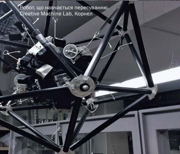
Робот, що навчається пересуванню. Creative Machine Lab, Корнел