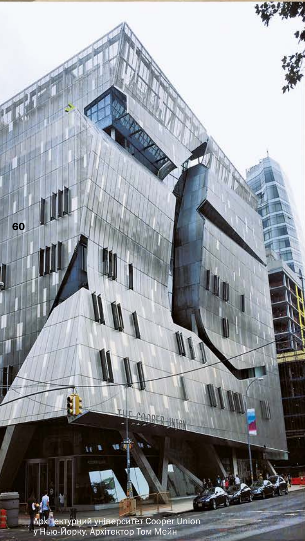
Архітектурний університет Соорег Union у Нью-Йорку. Архітектор Том Мейн