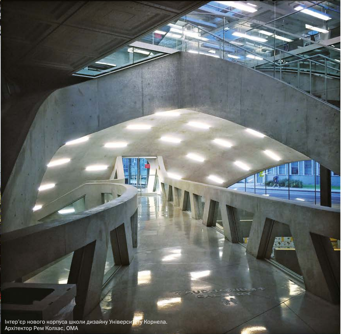
Інтер'єр нового корпусу школи дизайну Університету Корнела. Архітектор Рем Колхас, OMA