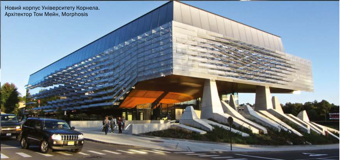
Новий корпус Університету Корнела. Архітектор Том Мейн, Morphosis